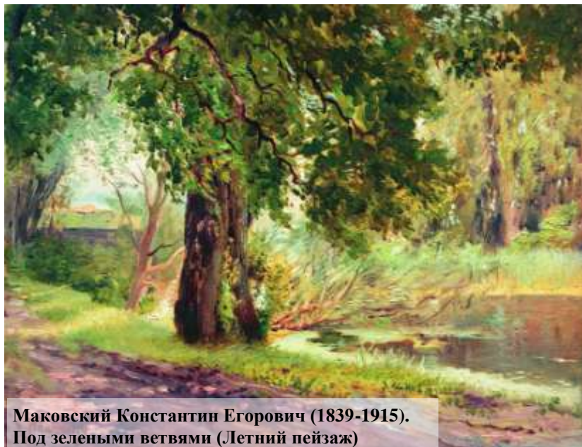
Маковский Константин Егорович (1839-1915). Под зелеными ветвями (Летний пейзаж)