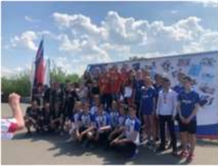
8 мая 2019 г. на Набережной

Космонавтов прошла легкоатлетическая эстафета «Вперёд, к Победе!», посвящённая 74-ой годовщине Победы в Великой Отечественной войне. В городской эстафете приняла участие команда гимназии и заняла почетное 3 место. Наши поздравления призёрам эстафеты!