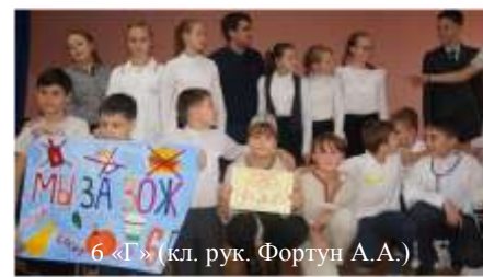
6 «Г» (кл. рук. Фортун А.А.)