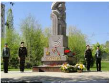
Вахта Памяти в сквере «Победа»