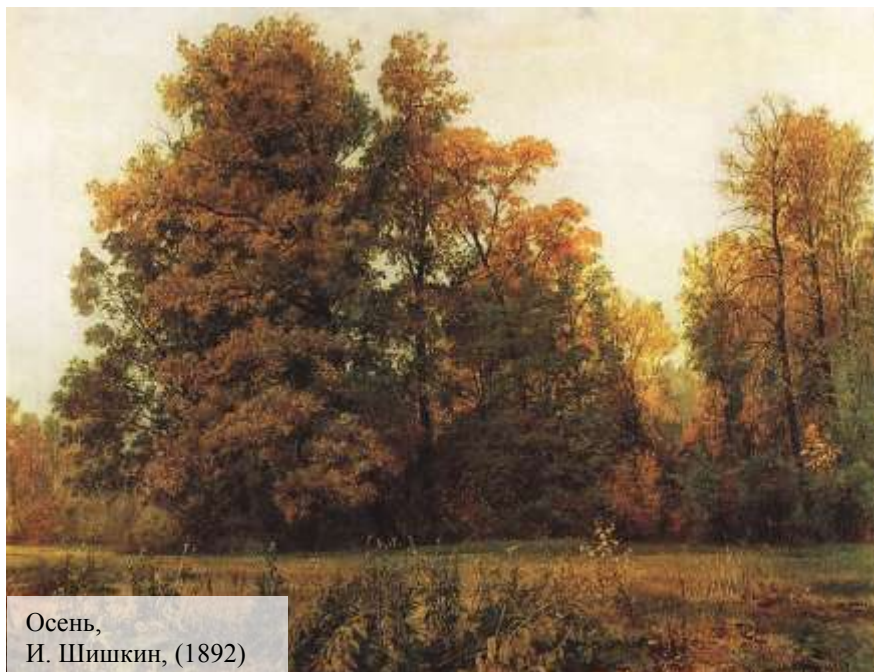
Осень, И. Шишкин, (1892)

Чудные краски осень разводит, Сидя на ветке бордовой осины, Золотом листья березы рисует, Вешает грозди на ветви калины. Водит в тумане она хороводы В платье различных цветов листопада, Шелестом вновь усыпляя природу, Плачет одна в отдалении сада. Ветром холодным изящно сплетает Черное кружево веток безлистных, А под ногами ковер расстилает Красных, лиловых тонов, золотистых.