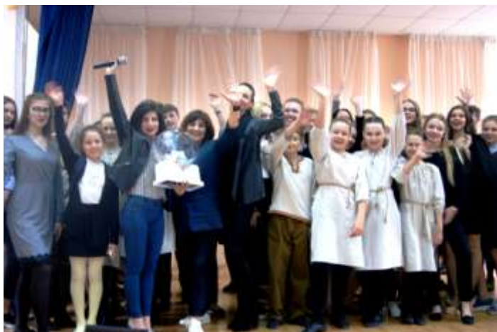
Социально значимая акция «Ладочки» в рамках благотворительного проекта «28 петель»

Благотворительный марафон «Гимназия №87 – ЗооСпасу Саратова»