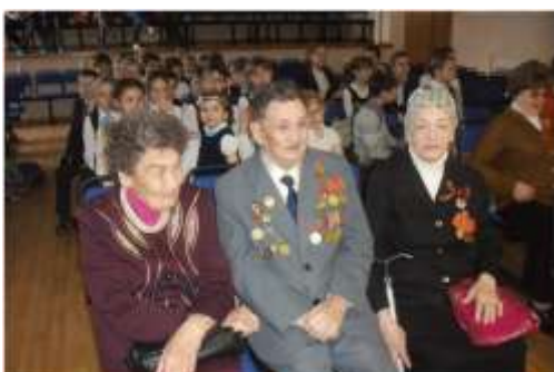
Акция «Ветераны. День пожилого человека»