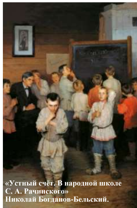
«Устный счёт. В народной школе С. А. Рачинского» Николай Богданов-Бельский.